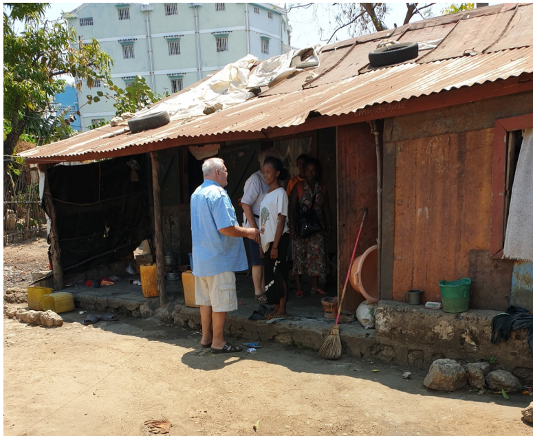
Vue du baraquement dont elles ne disposent que de 6 m 2 sur la droite.