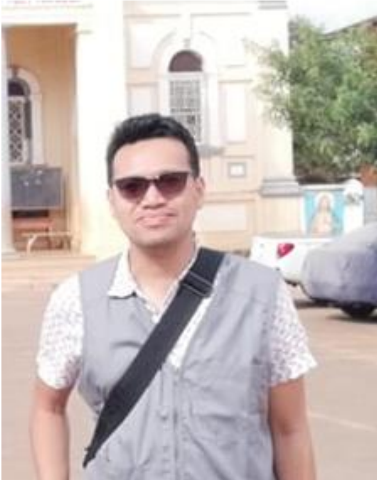
TOKY Architecte dessinateur Accompagnateur et photographe.