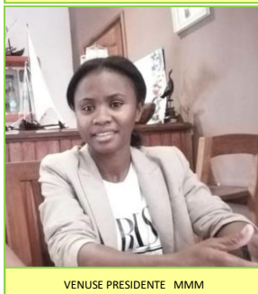
VENUSE PRESIDENTE MMM