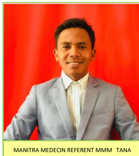
MANITRA MEDECIN REFERENT MMM TANA