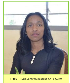
TOKY: INFIRMIERE/MINISTRE DE LA SANTE

Le plan d'action préconisé par ces volontaires : « - Reconstruction du centre ou réhabilitation plus adaptée à la situation géographique et aux aléas climatiques. - Électrification du centre par panneaux solaires - Approvisionnement en eau - Approvisionnement des ressources : matériels médicaux - Organiser des Missions humanitaires avec des médecins volontaires et bénévoles malgaches et autres (chirurgiens, M Généralistes, dentistes, ophtalmologistes...) »