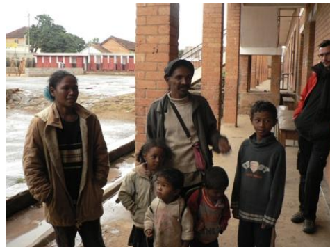
Toute la famille