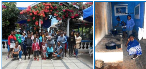
Fête de Noël à Tananarive

L'organisation des ateliers a été renforcée, des réunions motivantes des équipes ont eu lieu dans le but de faire progresser l'autonomie financière.