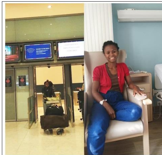
Le voyage de la dernière chance...