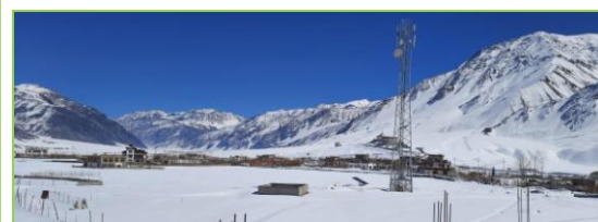
Fin février la vallée du Zanskar

Merci A tous les membres de nos équipes A nos fidèles adhérents, marraines/parrains et donateurs.