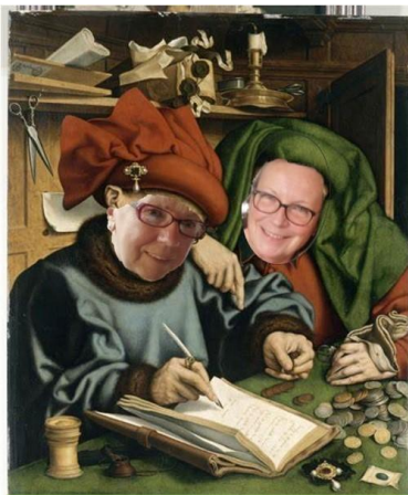
La trésorière et sa contrôlease

Le rapport moral a été validé à l'unanimité.