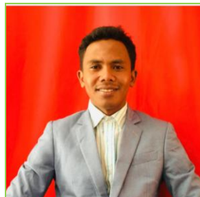
MANITRA MEDECIN REFERENT MMM TANA