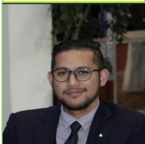
HERVE: MINISTRE DE LA SANTE

2014, après « rafraîchissement du bâtiment »