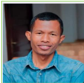
CHRISTIAN MEDECIN TANA

Nous souhaitons compléter l'équipe avec des membres du Rotary Malgache pour un partenariat concret qui rendrait possible un soutien financier conséquent.