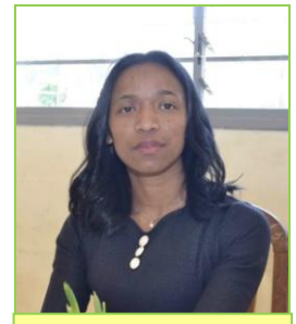
TOKY: INFIRMIERE/MINISTRE DE LA SANTE

Le plan d'action préconisé par ces volontaires : « - Reconstruction du centre ou réhabilitation plus adaptée à la situation géographique et aux aléas climatiques. - Électrification du centre par panneaux solaires - Approvisionnement en eau - Approvisionnement des ressources : matériels médicaux - Organiser des Missions humanitaires avec des médecins volontaires et bénévoles malgaches et autres (chirurgiens, M Généralistes, dentistes, ophtalmologistes...) »