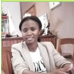
VENUSE PRESIDENTE MMM